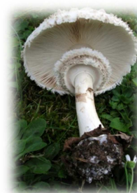
Lépiote Macrolepiota bohemica