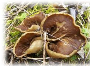
Pezize Disciotis venosa

Les Bolets et les Lépiotes sont des basidiomycètes .