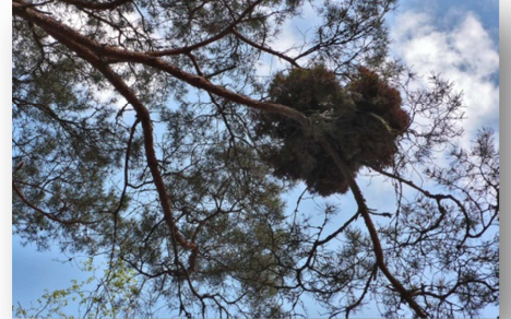
Forêt de Fontainebleau-J.B. Noel

Ils résultent de l'attaque de plusieurs espèces de champignons, des Ascomycètes chez les feuillus et des Basidiomycètes chez les résineux.