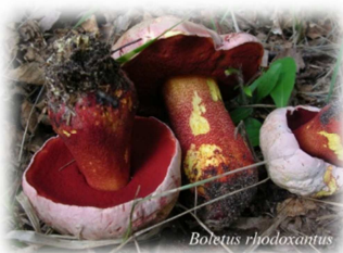
Bolet Boletus rhodoxantus

Les Bolets et les Lépiotes sont des basidiomycètes .