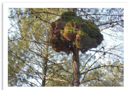
Balai de sorcière sur pin sylvestre dans les Trois pignons

Cette implantation forme une touffe d'aiguilles serrées qui ressemble à un balai, d'où la dénomination vulgaire sous laquelle elles sont connues.