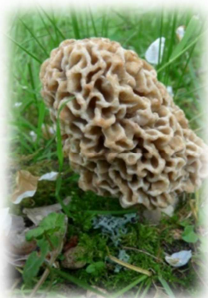
Morille Morchella esculenta

Voici quelques exemples de macromycètes que l'on rencontre dans la forêt : Les Morilles et les Pézizes sont des ascomycètes .