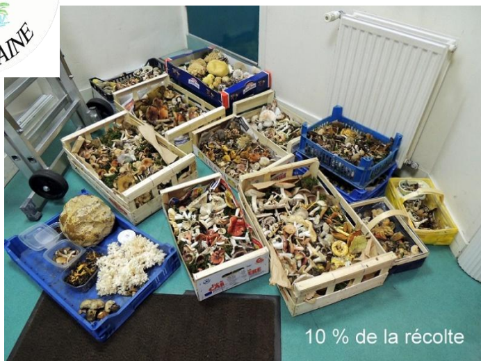
10 % de la récolte

Samedi matin à 8h et des poussières, c'était déjà la pleine effervescence pour identifier les récoltes