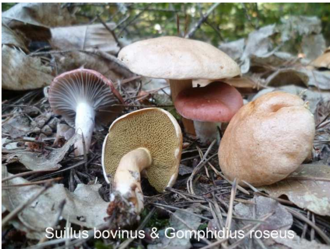
Suillus bovinus & Gomphidius roseus

comestibles pour satisfaire les mycophages avec majoritairement le Bolet bai ( Imleria badia ). A noter, la présence en quantité parmi les pins, du « Bolet des Bouviers » ( Suillus bovinus ), auquel est associé le « Gomphide rose » ( Gomphidius roseus ), beaucoup plus rare. Trouvé par Annette, coutumière des petites espèces, un